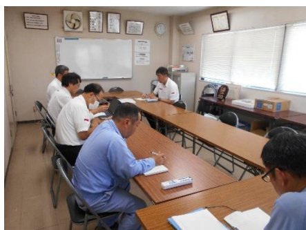
安全マネジメント会議

況、施設車両等の管理状況、苦情等のお客様の声、職場の問題点と解決方法等を議題とし、安全管理に取り組んでいます。