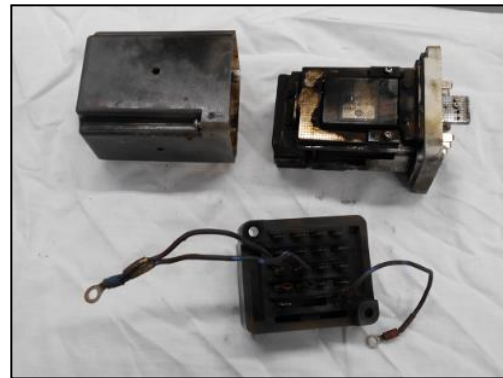
落雷により被害を受けた機器例