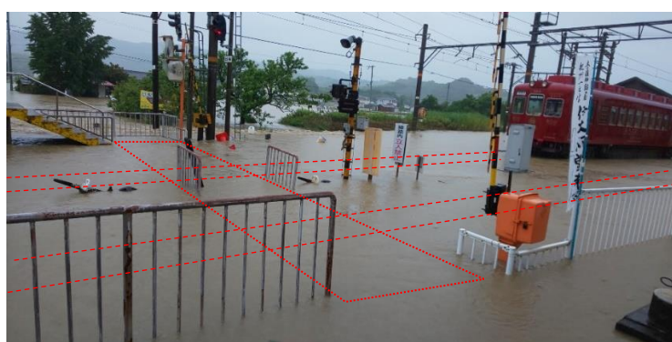
伊太祈曾駅構内の様子（線路、渡線路が完全に浸水）

道床流出 岡崎前～吉礼間 1ヶ所 吉礼～伊太祈曾間 3ヶ所 伊太祈曾～山東間 10ヶ所 計 17ヶ所 信号通信設備 踏切用軌道回路水没 2カ所 車両関係 車両モーター及びATS車上子への浸水 その他施設関係 伊太祈曾車庫点検用ピット水没 伊太祈曾本社各事務所、倉庫等の床上浸水 その他多数の予備品、備品、文書等の水没