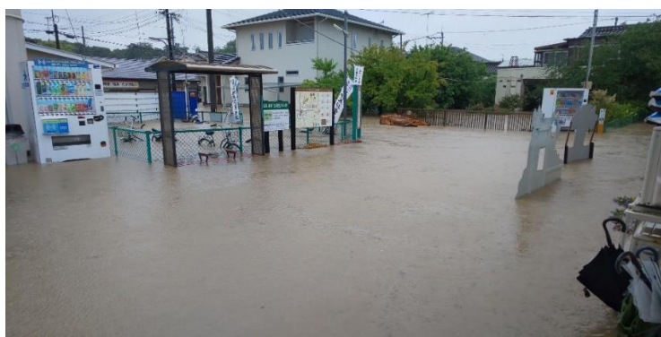
伊太祈曾駅前の様子